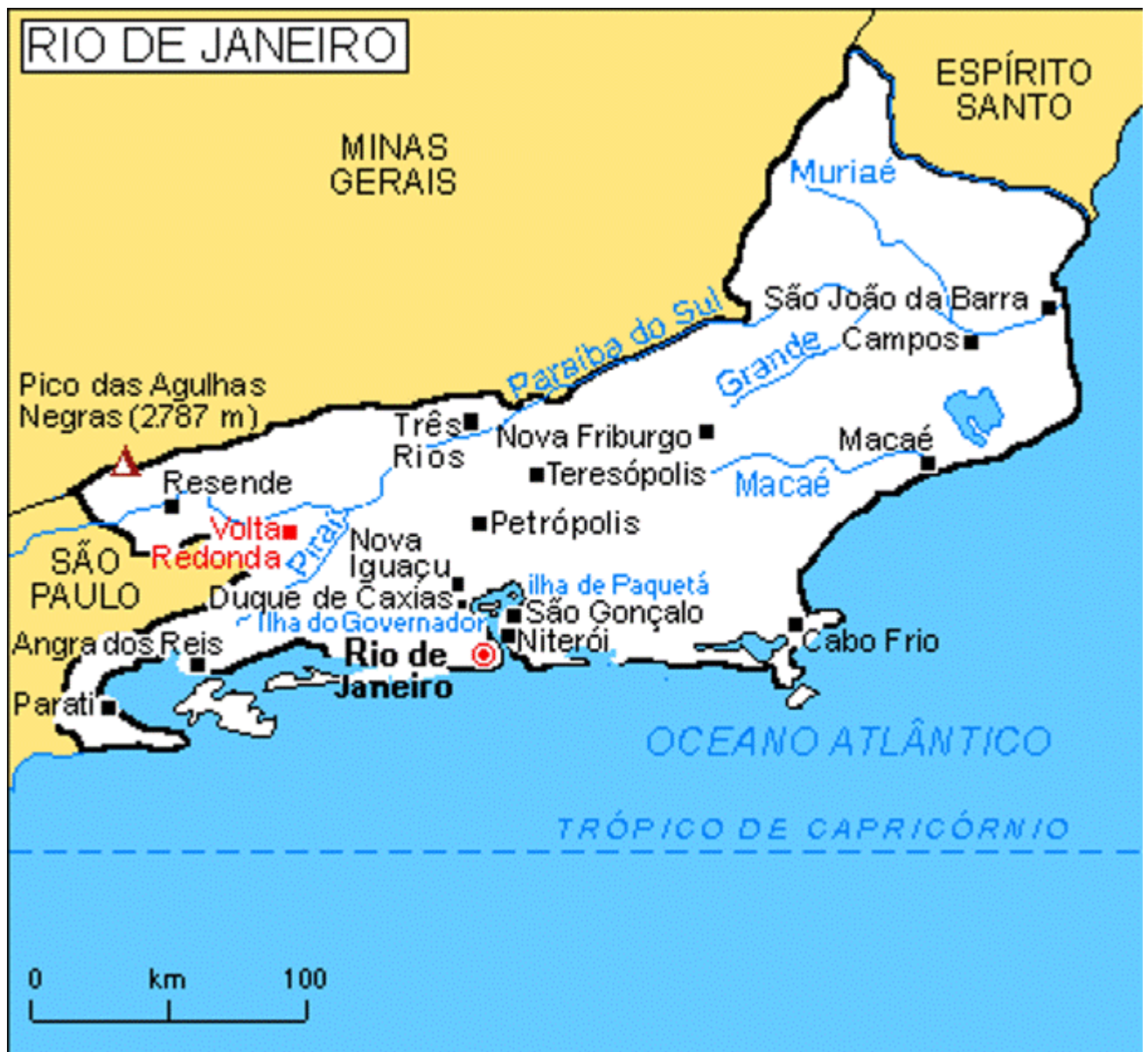
ANEXO B MAPA DO ESTADO DO RIO DE JANEIRO