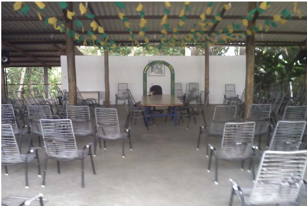
Núcleo Estrela da Manhã. Direito de imagem cedido pelo Departamento de Memória do CEBUDV. Foto: Gabriela Ricciardi.