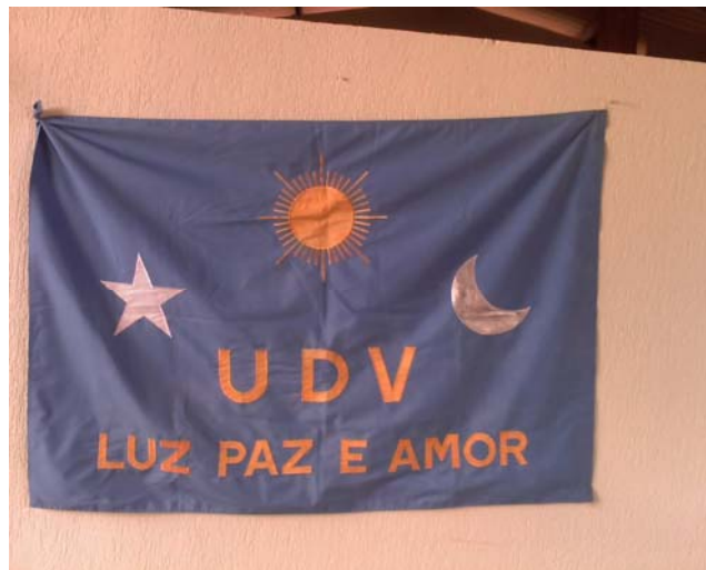
Bandeira da União do Vegetal.