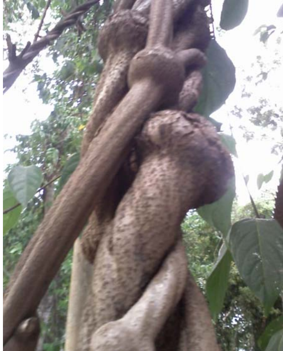
Mariri (Denominado Caupurí pelos adeptos da UDV).