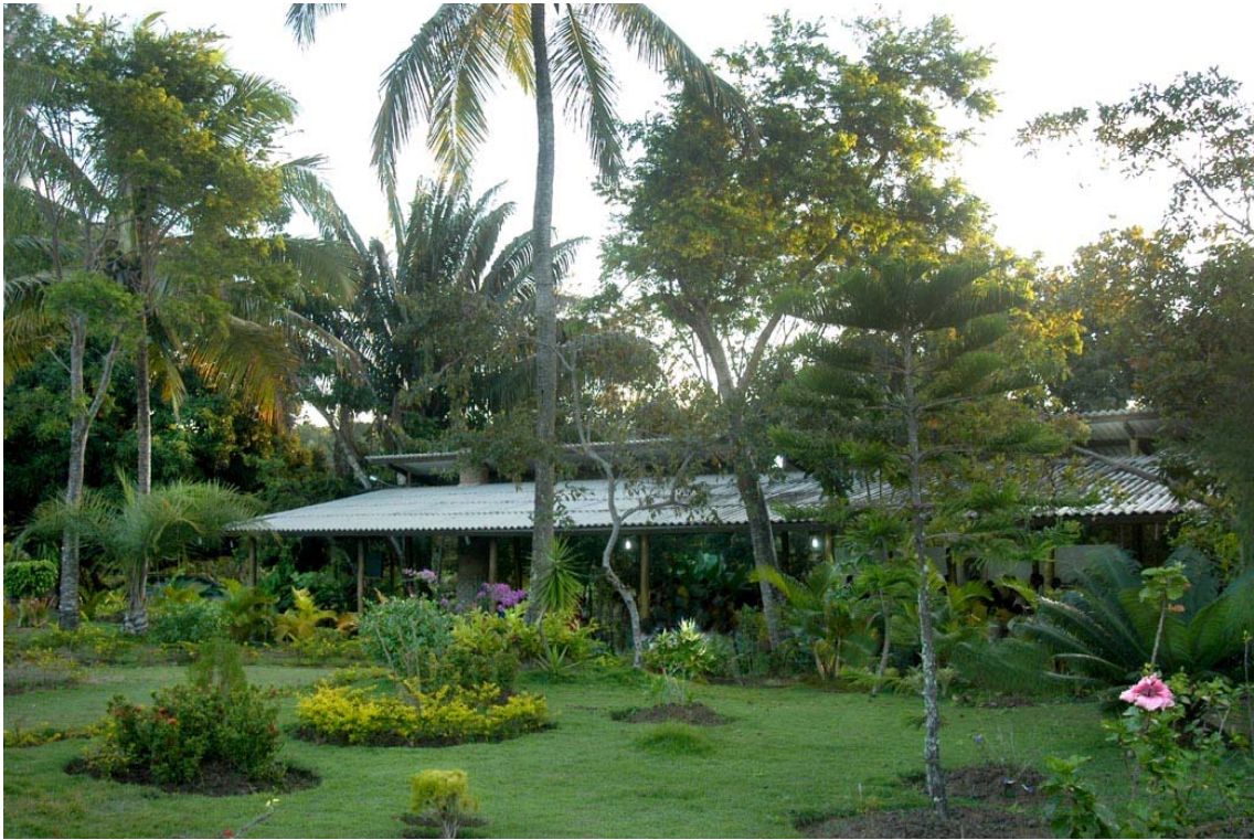
Núcleo Estrela da Manhã.