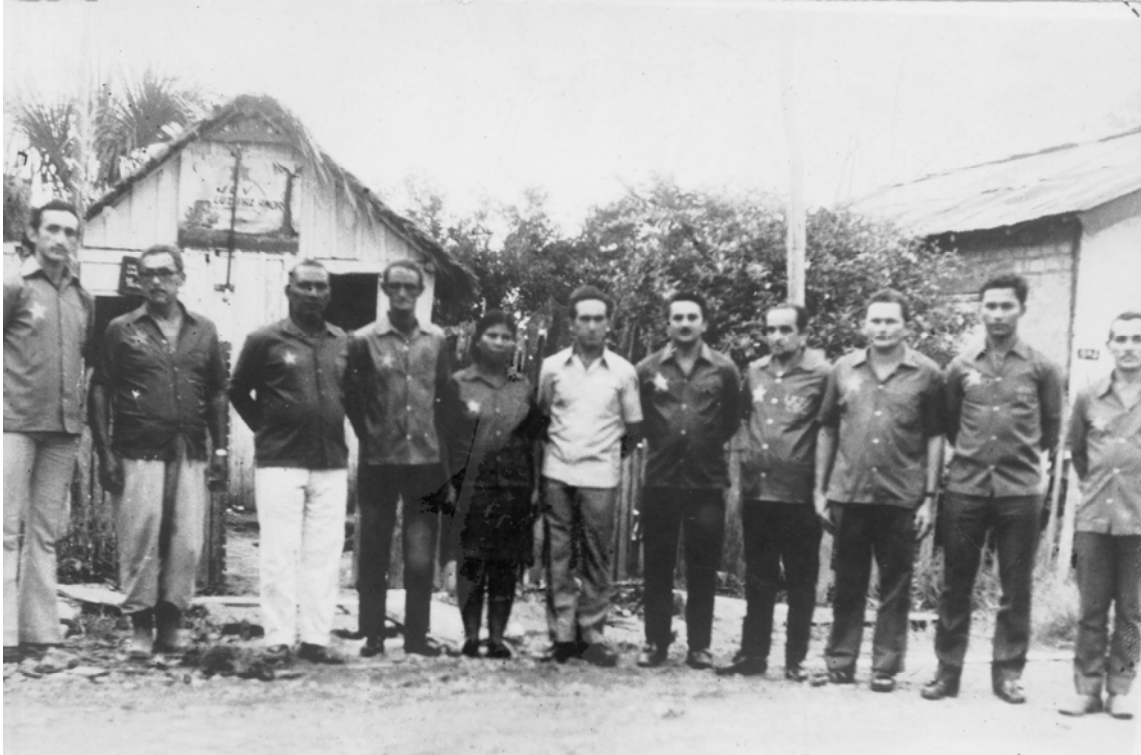
Quadro de mestres em frente à antiga sede. Década de sessenta, em Porto Velho (RO).