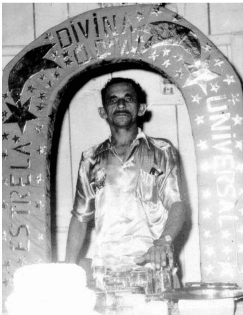
Mestre Gabriel no arco. Foto utilizada nos templos da União do Vegetal.

Existe um lugar destinado ao som e ao operador, que pode ser qualquer discípulo. O local onde acontecem as sessões é bem iluminado. Durante todo o ritual as luzes permanecem acesas. Próximo ao local das sessões existe uma mesa menor, com um recipiente com água potável ou mineral, e copos que podem ser de vidro, alumínio, inox ou plástico. Uma vasilha com (“tira gosto”) frutas: caju, laranja e maçã são as mais comuns, ou chicletes e balas. Essa disposição da arrumação varia de acordo com as unidades administrativas. Em alguns locais não existem vasilhas com “tira gosto”. O material dos copos também pode variar.