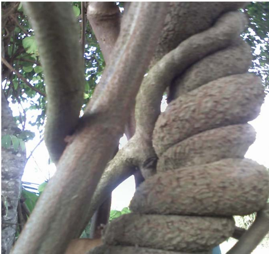
Marirí (Denominado Tucunacá pelos adeptos da UDV).