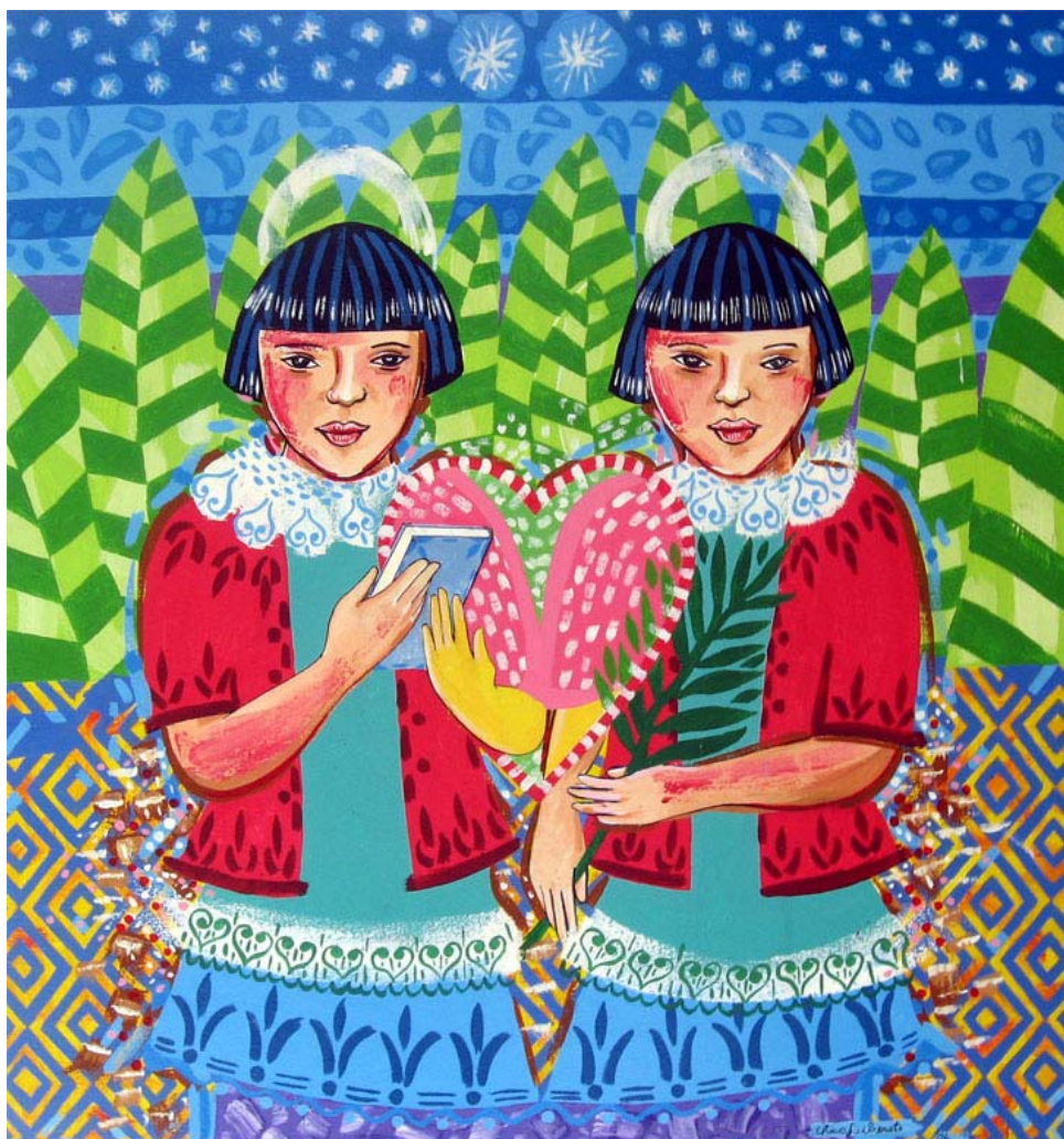
Cosme e Damião. Tela do artista plástico Chico Liberato.

Direito de imagem concedido pelo artista.